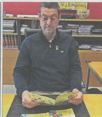
Bona part del terme de Castelló és terreny natural protegit. L'alcalde, amb el llibret que consciència el ciutadà.