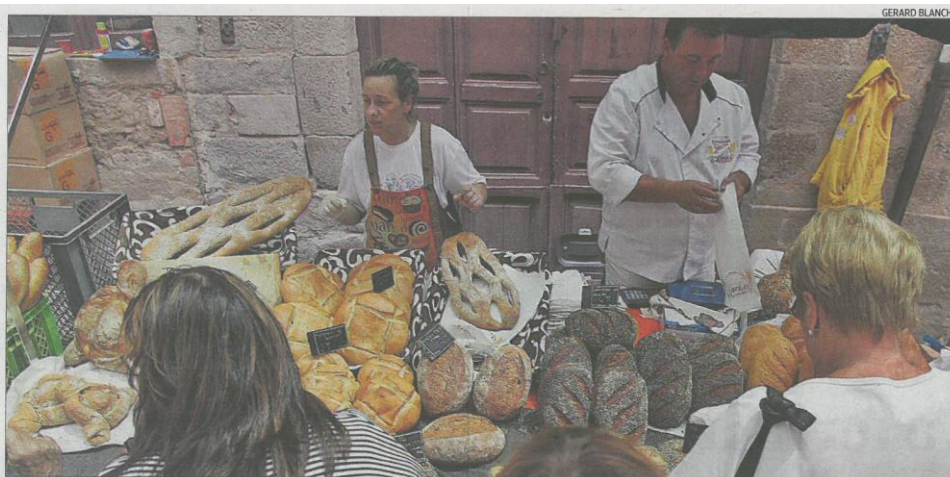
La Fira del Pa concentra diumenge les parades i un munt d'activitats lúdiques i culturals.