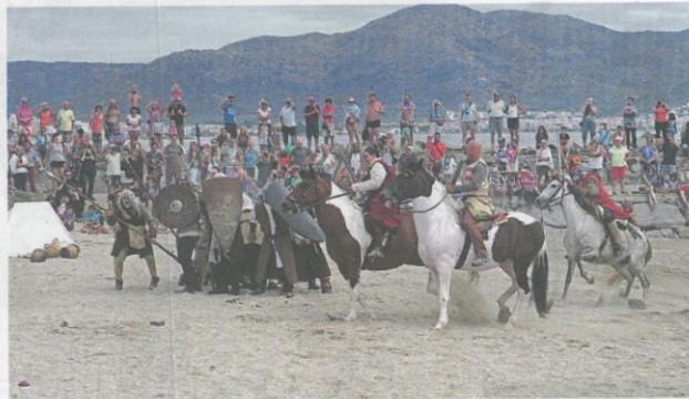
DESEMBARCAMENT MARÍTIM. Un dels instants de la posada en escena

EL DESEMBARCAMENT MARÍTIM. Tindrà lloc a les 19 h i es tracta d'una recreació històrica del desembarcament marítim de les tropes del rei Jaume I el Conqueridor per aturar la rebel·lió del com-