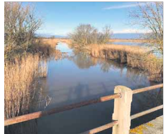
Una de les rieres, a la reserva integral

Es revegetaran i es restauraran els espais afectats per l'obertura d'accessos o de zones amb elevada presència de canya, mitjançant hidrosembres i plantacions. Es vol afavorir la integració paisatgís-